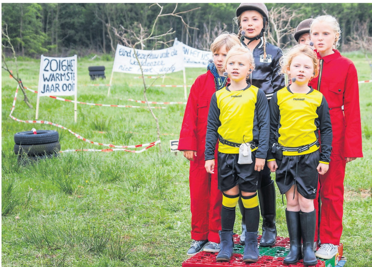
In de interactieve voorstelling Hallo dampkring probeert de nieuwe generatie de oudere met liedjes, spandoeken en door bomen te planten bewust te maken van de problemen die zij voor haar creëert.